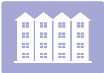
Таунхаусы и апартаменты