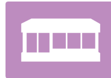
Коммерческие помещения и здания