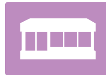
Коммерческие помещения и здания