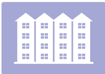
Таунхаусы и апартаменты