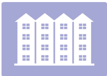
Таунхаусы и апартаменты